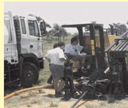
Figura 2 Tunelera a emplear en los atraques.

La zona de atraque es el punto más vulnerable ya que posee menos profundidad; en consecuencia, el cable requiere mayor protección. El tuneleo se realiza desde el registro de playa hacia el mar, instalando un bitubo de Ø 40 mm de diámetro (figura 5).