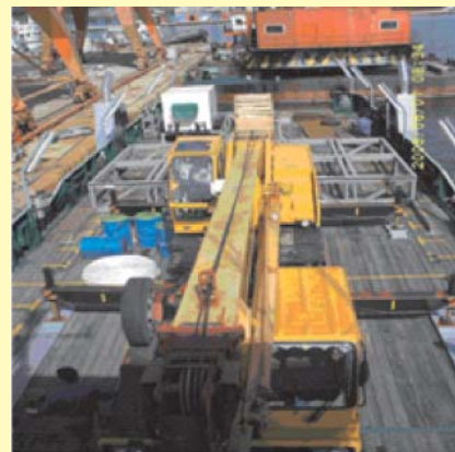
Figura 5 Distribución de equipos en el barco Saturno (Fuente: archivo del autor).

las bobinas y una canal. Todos estos equipos están distribuidos en el barco Saturno de forma tal que no afecta la estructura de la embarcación ni el tránsito por la cubierta del personal a bordo. Esto permite que las labores de tendido y empalme se realicen sin riesgo de accidentes (Figura 5).