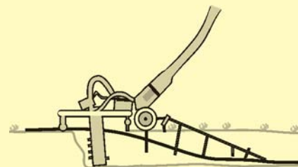
Figura 3 Máquina a emplear para el enterramiento del cable.

La protección del cable en los fondos con sedimentos sueltos se realiza con el empleo de una zanjadora como la que se representa en la figura 3.